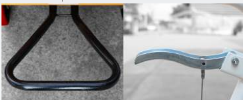
FOOT PEDAL & PULLING LEVER