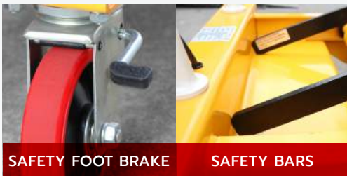
SAFETY FOOT BRAKE